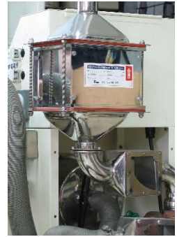
▲ 加裝 HEPA Filter