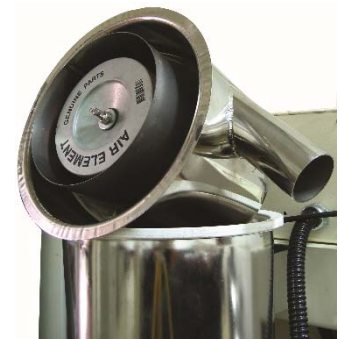
▲ Filter 與集塵器一體設計